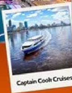
Captain Cook Cruises

5 วัน 3 คืน ดะวันตก ออสเตรเลีย พักโรงแรมใจกลางเมือง