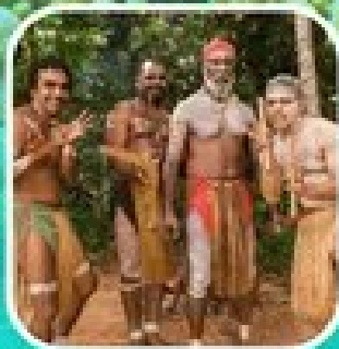
Rainforestation Aboriginal Show