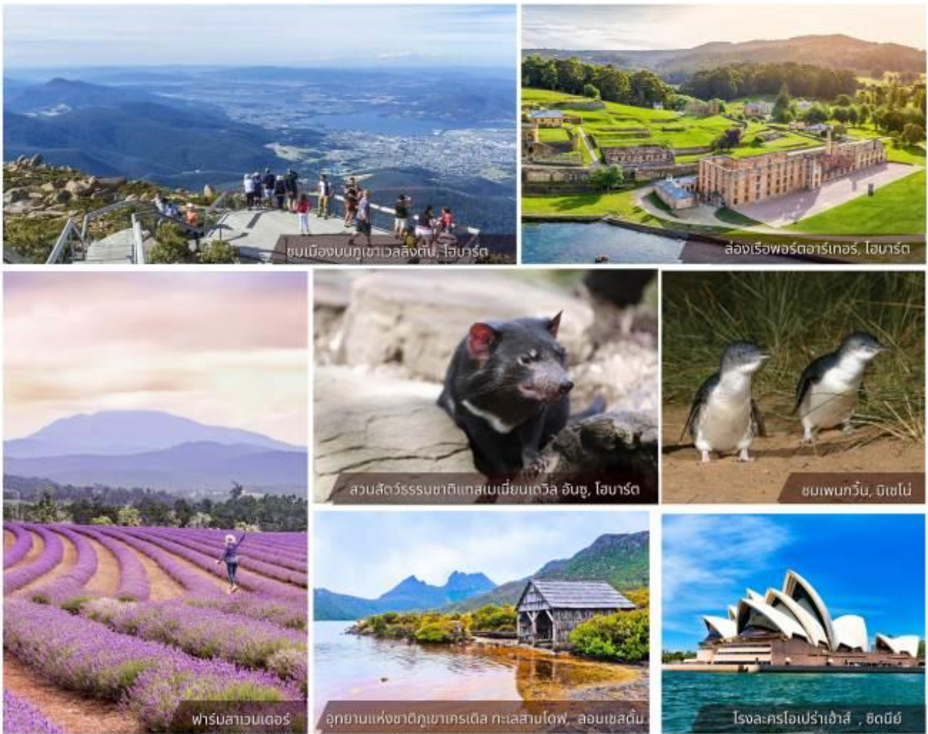
ชมเมืองบนภูเขาเวสต์ลิงตัน, โฮบาร์ต