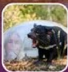
ชม Tasmanian Devil