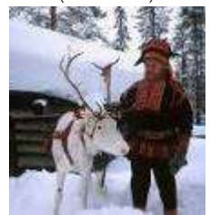
Local (155 ก.ม.)

ออกเดินทางตลอดอุโมงค์กลับสู่ฝั่งแผ่นดินใหญ่ ณ ดินแดนตอนเหนือของประเทศฟินแลนด์ ที่เรียกว่าเขตฟินน์มาร์ก หรือเขตแลปป์แลนด์ บริเวณแถบนี้เป็นที่อยู่อาศัยของชาวแลปป์ หรือ อีกชื่อหนึ่งคือซามิ (Sami) นำคณะข้ามพรมแดนสู่ประเทศฟินแลนด์เมืองคาราสจอก