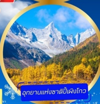
อุทยานแห่งชาติหนีเฟิงโกว