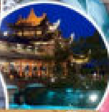
วัดพุทธมณฑลต้าหลู