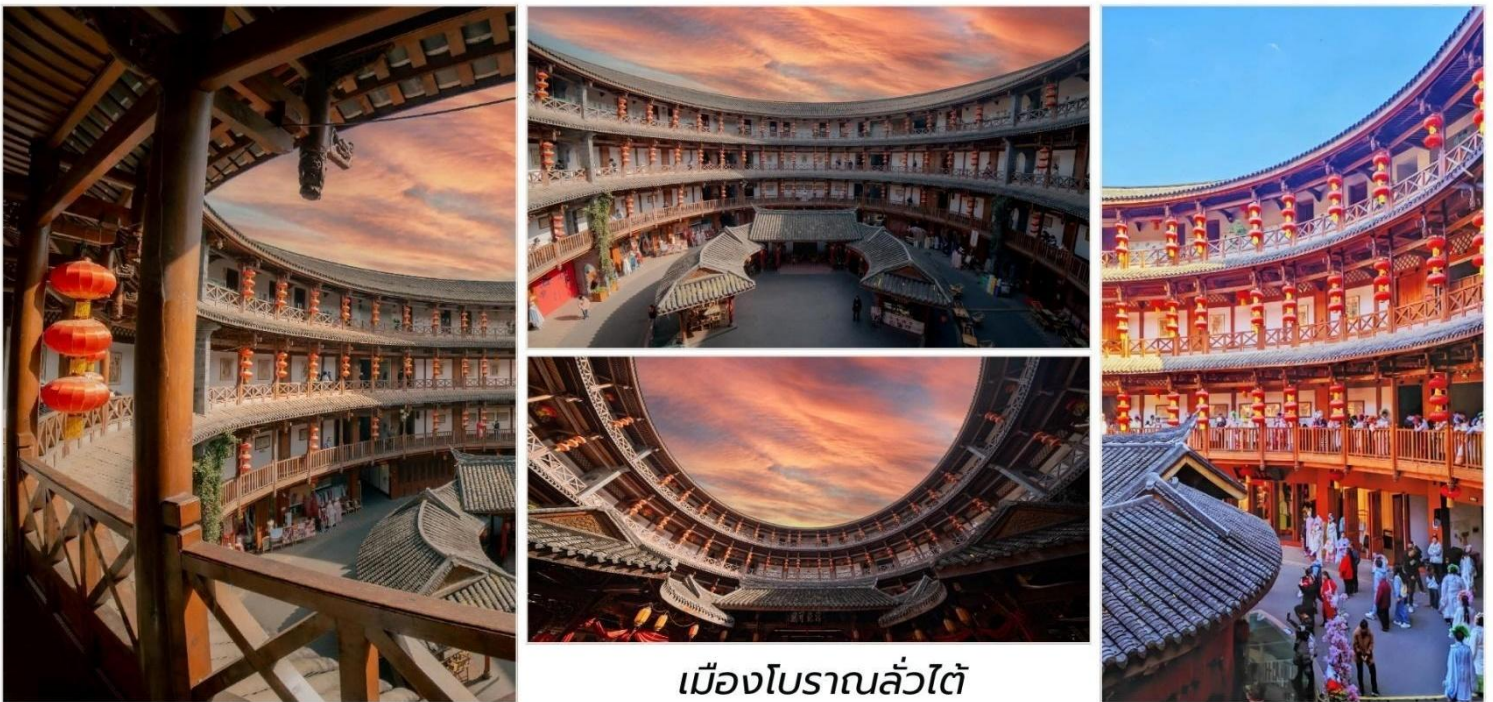
เมืองโบราณลั่วไต

บ่าย จากนั้นเดินทางไปยัง วัดต้าจื่อ เป็นวัดเก่าแก่ที่มีอายุยาวนานกว่า 1,600 ปี ตั้งอยู่ใจกลางของ Chengdu ที่นี่ถือเป็นสถานที่สำคัญที่น่าสนใจ เพราะเป็นวัดที่พระถังซำจั๋งบวชเป็นพระภิกษุก่อนจะย้ายไปจำพรรษายังวัดอื่นภายในวัดต้าสือนั้นเจียบสงบ จากนั้นนำท่านสู่ ถนนคนเดินซุนซีลู่ เป็นย่านวัยรุ่นเปรียบได้กับสยามสแคว์ ซึ่งขายสินค้าที่ทันสมัยเป็นถนนที่ปิด ไม่ให้รถวิ่งผ่านได้ ห้างดังในย่านนี้มีให้เลือกช้อปปิ้งมากมายหลากหลาย จากนั้นนำท่านชม หมีแพนด้ายักษ์ กำลังปิ่นตึก IFS เป็นอีกหนึ่งแลนด์มาร์ค ที่ใครมาเจียงตูแล้วต้องมาเช็กอิน