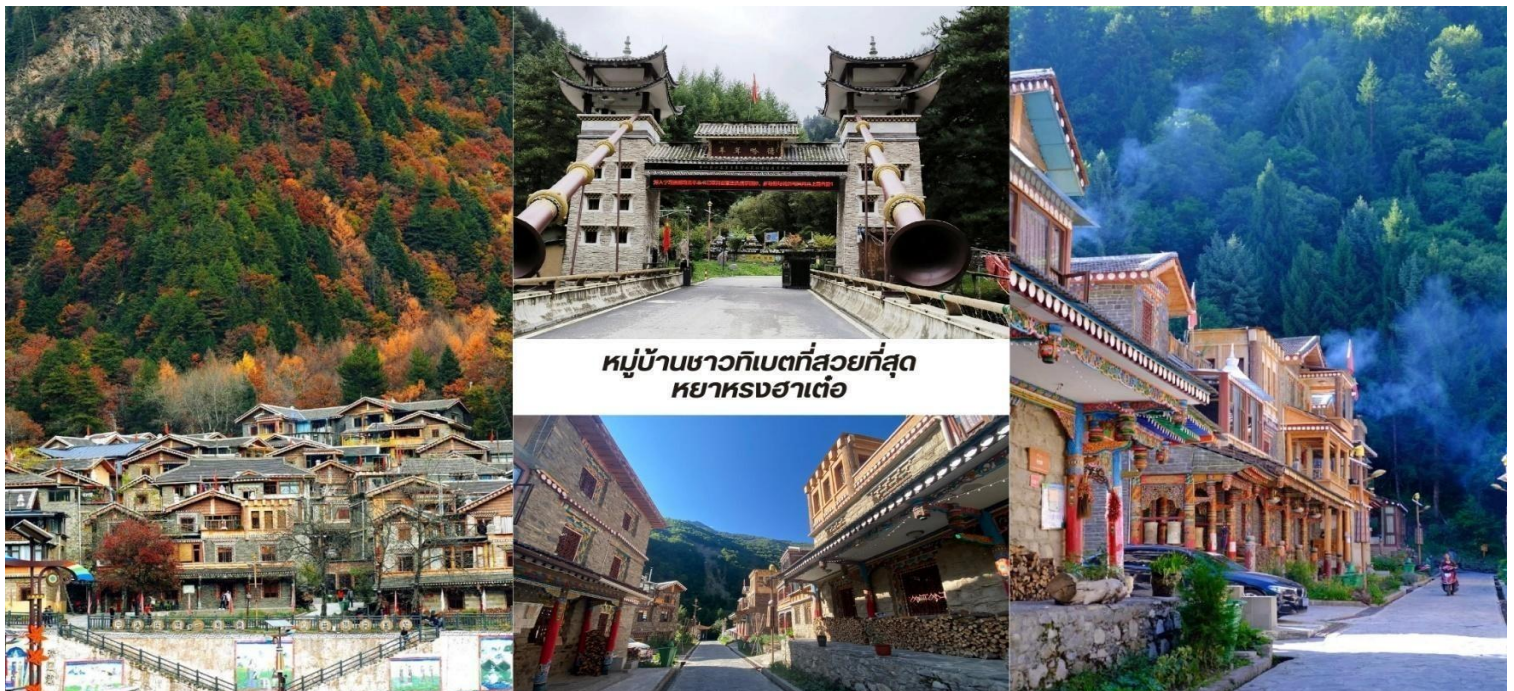
หมู่บ้านชาวทิเบตที่สวยงามที่สุด หย่าหงฮาเต๋อ

บ่าย นำท่านชม หมู่บ้านชาวทิเบตที่สวยงามที่สุด หย่าหงฮาเต๋อ (Yangrong Hades, 羊茸哈德) หมู่บ้าน แห่งนี้เคยเป็นหมู่บ้านยากจนบนภูเขา แต่ด้วยการย้ายถิ่นฐานและพัฒนาการท่องเที่ยว ทำให้กลายเป็นจุดหมายปลายทางที่ดึงดูดนักท่องเที่ยวจากทั่วโลก ทัศนียภาพอันงดงาม หย่าหงฮาเต๋อล้อมรอบด้วยภูเขาสูงมีแม่น้ำเฮย์สุย (黑水河) ไหลผ่านและป่าไม้เขียวชอุ่มตลอดปี โดยเฉพาะในฤดูใบไม้ร่วง ป่าไม้จะเปลี่ยนเป็นสีสดใสของใบไม้เปลี่ยนสีทำให้ ทั้งหมู่บ้านดูเหมือนอยู่ในภาพวาดอันงดงาม หมู่บ้านนี้ยังคงรักษาเอกลักษณ์วัฒนธรรมทิเบตดั้งเดิม ทั้งการ แต่งกาย อาหารท้องถิ่นและพิธีกรรมทางศาสนา หย่าหงฮาเต๋อ ไม่เพียงแต่เป็นสถานที่ท่องเที่ยวที่สวยงามเท่านั้น แต่ยังเป็น หมู่บ้านที่สะท้อนให้เห็นถึงการพัฒนาจากความยากจนสู่ความมั่งคั่งผ่านการผสมผสานการอนุรักษ์วัฒนธรรมดั้งเดิมกับ การท่องเที่ยวได้อย่างลงตัว