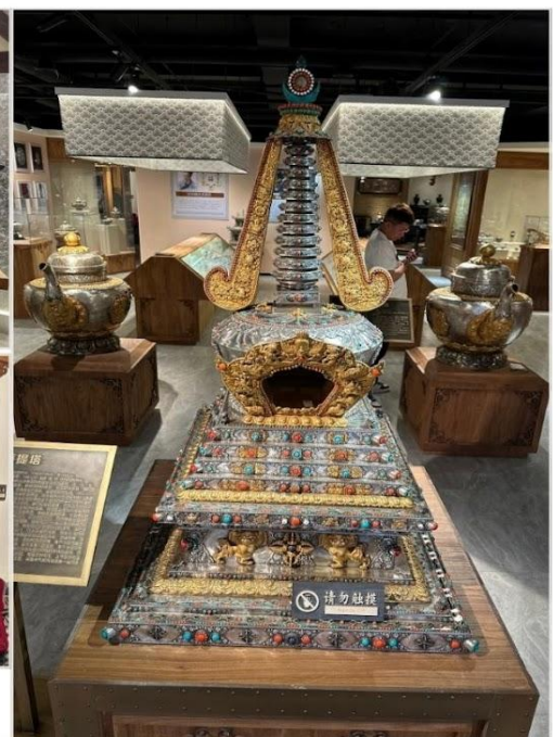
ร้านเครื่องเงินมองโกล