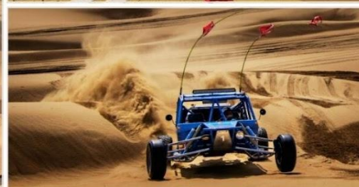
OPTION TOUR เลือกซื้อกิจกรรม สนุกสุดเหวี่ยงในทะเลทราย