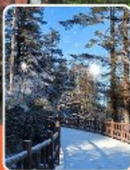
ภูเขาหว่าอูซาน