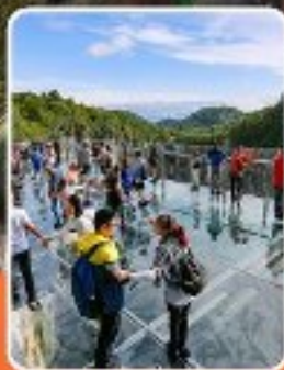
ระเบียบแก่ว๋หลง

ภูเขาหว่าอูซาน (รวมขึ้นกระเช้าไป-กลับ)- อุทยานเขานางฟ้า อุทยานหลุมฟ้าสะพานสวรรค์ - ระเบียบแก่ว๋หลง - รถไฟฟ้าทะเลตึก หงหยาดัง - วัดเป่ากั๋ว - หลวงพ่อโตเสอซาน - วัดต้าอิว หมี่เพนค้ายักษ์ ซุปปิ้ง ถนนคนเดินซุนซู่ โถงุหลี่