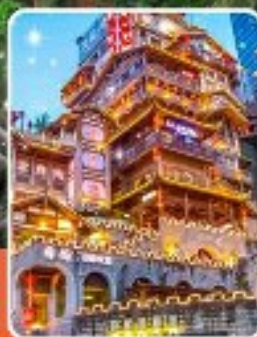
หงหยาดัง