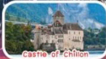
Castle of Chillon