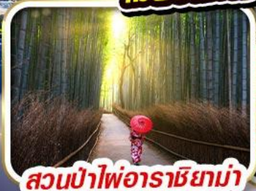
สวนป่าไฟอาราชิยาม่า

ราคาเริ่มต้น 29,999 *รวมภาษีมูลค่าเพิ่มแล้ว*