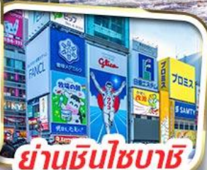
ย่านชินไซบาชิ