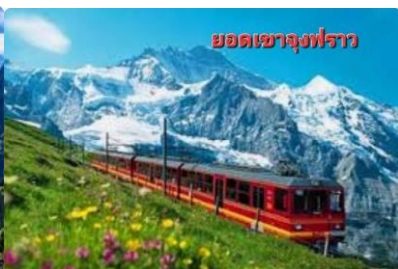
ยอดเขาจุงฟราว

จากนั้นนำท่านเดินทางสู่ สถานีกรินเดอร์วัลล์ เพื่อพาท่านนั่งกระเช้าไอเกอร์เอ็กซ์เพรส (EIGER EXPRESS) ขึ้นสู่สถานี EIGERGLETCHER ด้วยเวลาเพียง 15 นาที และต่อด้วยรถไฟขึ้นสู่ยอดเขาจุงฟราวน์ TOP OF EUROPE เมื่อถึงยอดเขาแล้วท่านจะได้สัมผัสกับทัศนียภาพอันงดงาม