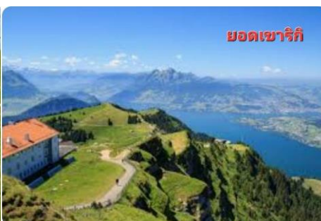
ยอดเขาริกิ

ธรรมชาติ อากาศดี...แล้วนำท่านนั่งรถ ไต่เขา RIGI ถือเป็นรถไฟไต่เขาที่เก่าแก่ ที่สุดในยุโรป จากความสูงจาก