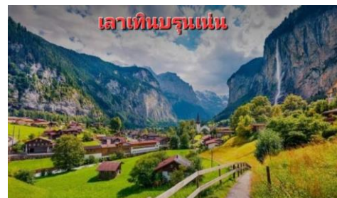
เลาเทินบรุนเน่น

บ่าย จากนั้นอิสระให้ท่านมีเวลาอย่างเต็มที่ที่จะเก็บภาพที่ระลึกบนลานกว้างที่เต็มไปด้วยหิมะชาวโพลนให้ท่านได้สนุกสนานอย่างเต็มอิม จนถึงเวลาอันสมควร จึงนำท่านเดินทางกลับโดยใช้เส้นทางที่สวยแสนโรแมนติกอีกเส้นทางหนึ่ง โดยการนั่งรถไฟชมวิวกว๊าทซ์เคินส์ฝั่งสู่ เมืองเลเทียร์ นบรุนเน่น (LAUTER BRUNNEN) ...เดินทางถึงเมืองลูเซิร์น