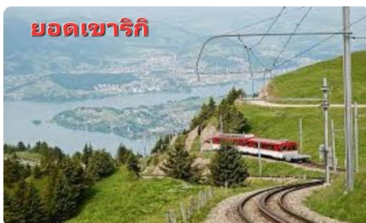
ยอดเขาริกิ

นำท่านเดินทางสู่ เมืองเวกกีส์ (WEGGIS) (136 กม.) เมืองน่ารักริมทะเลสาบลูเซิร์นเป็นเมืองเล็กๆ ที่มีความเป็น