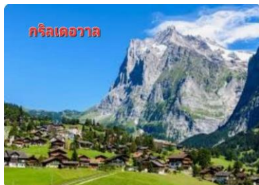
กลินเดอร์วัลล์

เช้า รับประทานอาหารเช้า ณ ห้องอาหารโรงแรม