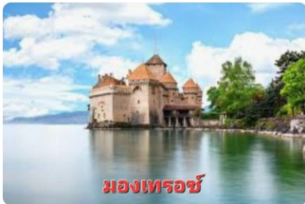
มงเทรอซ์

ออกเดินทางสู่ เมืองมงเทรอ (MONTREUX) (140 กม.) ...ระหว่างทางแวะถ่ายภาพความงดงามของ ปราสาท