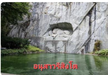
อนุสาวรีย์สิงโต

(LUCERNE) (79 กม.)...นำท่านถ่ายรูปคู่กับ อนุสาวรีย์สิงโต (LION MONUMENT) ซึ่งแกะสลักอยู่บนหน้าผาของ