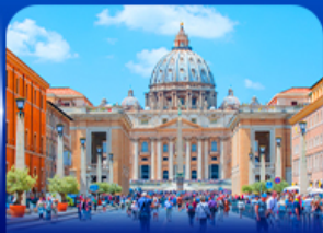
นครรัฐวาติกัน โรม