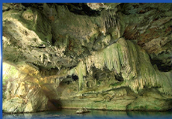
ถ้ำทะเลถอบ Unseen Thailand