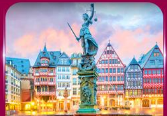
จัตุรัสโรเมอร์ แพรงก์เฟิร์ต