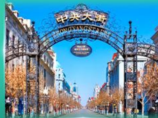
ย่านจงหยาง สตรีท