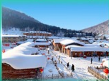
หมู่บ้านหิมะ สโนว์ทาวน์