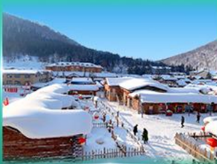
หมู่บ้านหิมะ สโนว์ทาวน์