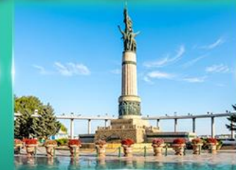
อนุสาวรีย์ผู้หญิง