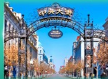
ย่านจงหยาง สตรีท