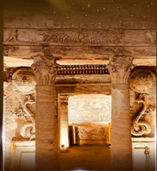
สุสานใต้ดินอเล็กซานเดรีย