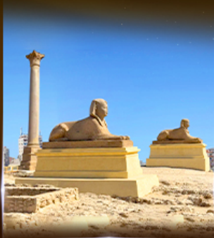
เสารัมปองเมย์