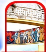
อนุสาวรีย์ โซซาน