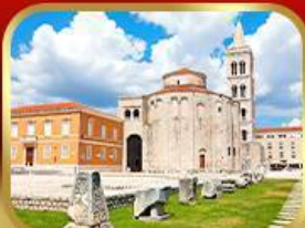
โบสถ์เซนต์โทมัส ชาตาร์