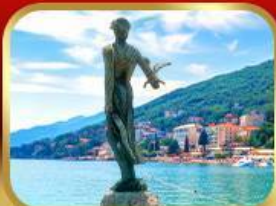
ราชินีแห่งอาเดรียติก โอฟาเทีย