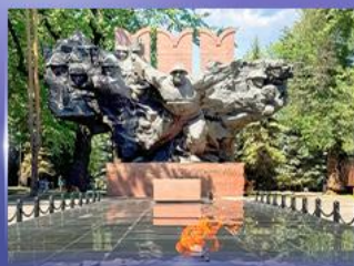
สวนสาธารณะ 28 Panfilov Park