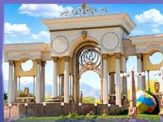
สวนสาธารณะประธาธิบดี