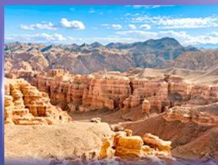
หุบเขาชาริน แคนยอน