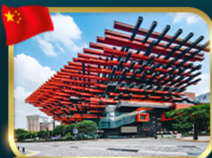
แลนด์มาร์กจั๊ว ตึกตะเกียบ