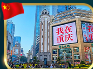
ถนนคนเดินเจียงฟางเป่ย์