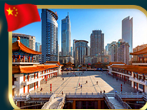
เข็คอินตึกไคว่ซังโหล