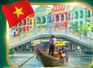
เวนิสจำลอง แกรนด์ เวิลด์