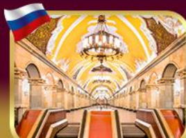
สถานีรถไฟใต้ดินกรุงมอสโก