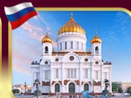
มหาวิหารเซนต์ซาเวียร์