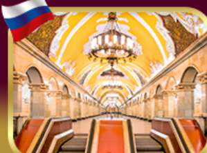
สถานีรถไฟใต้ดินกรุงมอสโก