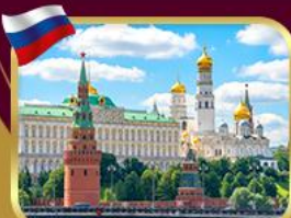
พระราชวังเครมลิน