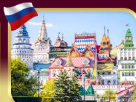
อิสมาลอฟสกีมาร์เก็ต