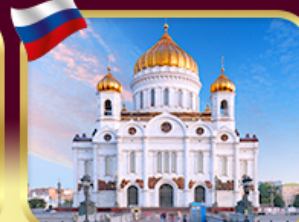
มหาวิหารเซนต์ซาเวียร์