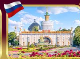
สวนสาธารณะ VDNKH