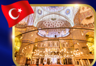
ชมความงามสุเหร่าสีน้ำเงิน