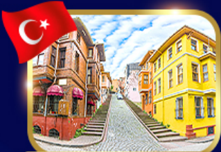
ชมบ้านหลากสี ย่านบาลีก