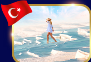
ปราสาทปูนิาย ปามุคคาเล่