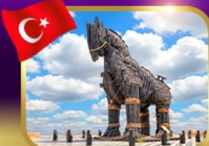
ม้าไม้เมืองทรอย ซานักคาล์