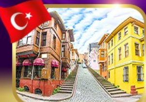
ชมบ้านหลากสีย่านขาลิก