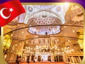
เข้าชมความงามสุเหร่าสีน้ำเงิน