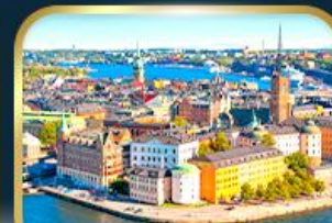
เที่ยวเมืองสต็อกโฮล์ม