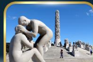
สวนอุทยานฟรอกเนอร์