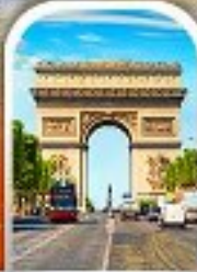
ARC DE TRIOMPHE FRANCE