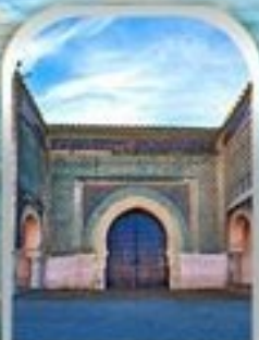
KASBAH OF MOULAY ISMAIL