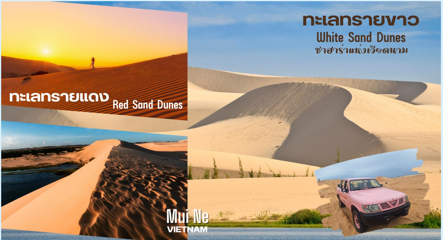
ทะเลทรายขาว White Sand Dunes ซาฮาราแห่งเวียดนาม