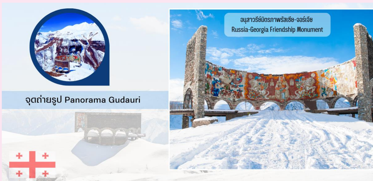
จุดถ่ายรูป Panorama Gudauri