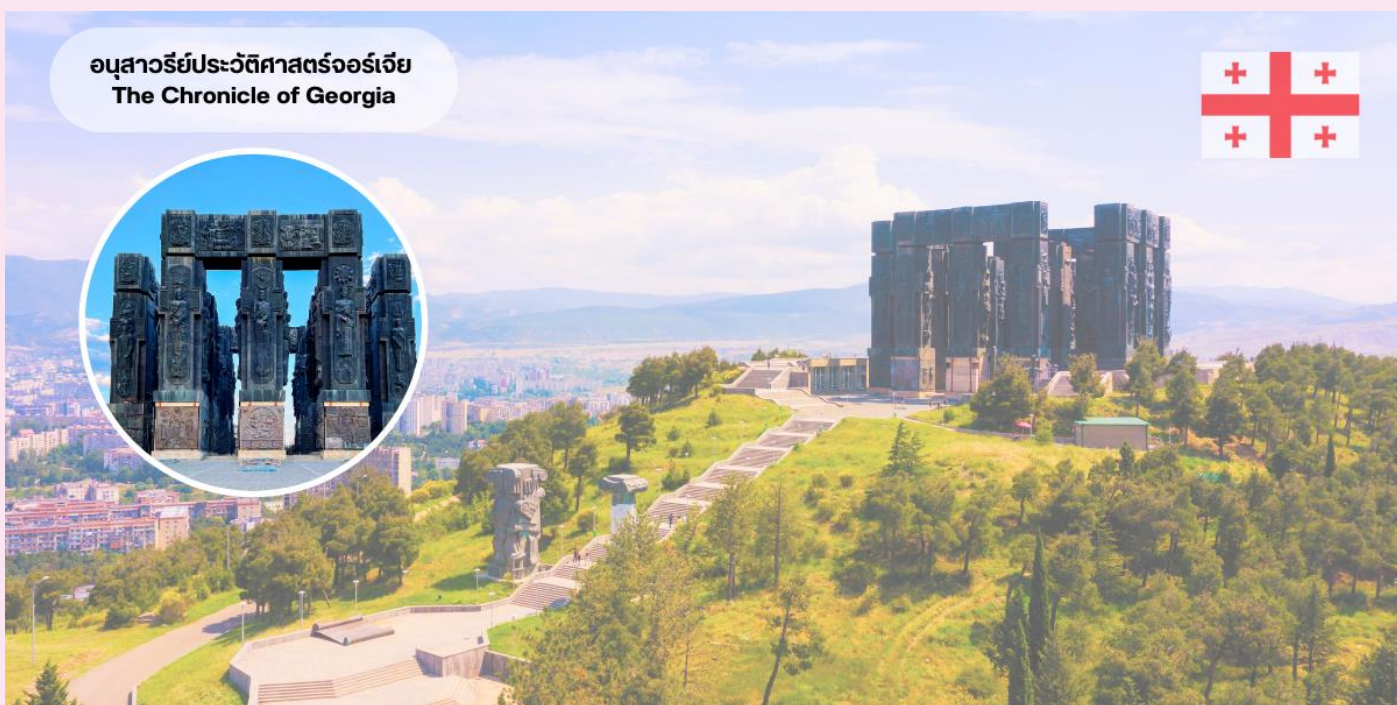
อนุสาวรีย์ประวัติศาสตร์จอร์เจีย The Chronicle of Georgia

ชมความอลังการเสวยักษ์ และย้อนรอยประวัติศาสตร์จอร์เจีย “อนุสรณ์ประวัติศาสตร์จอร์เจีย” ได้ชื่อว่าเป็น “ Stonehenge of Georgia “