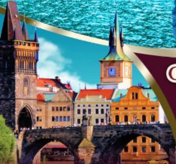
Charles Bridge -czech-