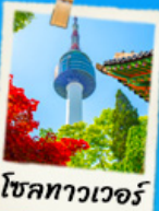
โซลทาวเวอร์