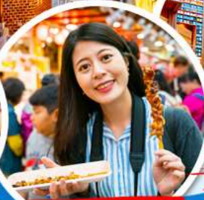
- ตลาดควางจั้ง