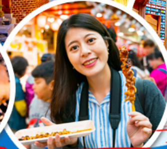
ตลาดควางจ้ง