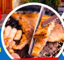
นมุย่างเกาหลี