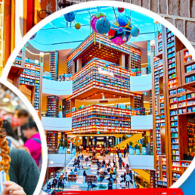
ห้องสมุด Starfield