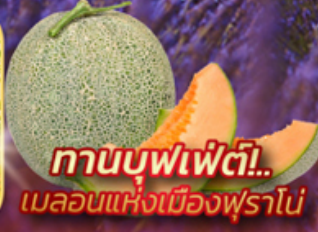
ทานบุฟเฟ่ต์! เมลอนแห่งเมืองฟุราโน่