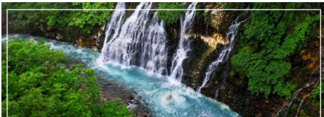
SHIRAHIGE WATERFALL น้ำตกชิราฮิเกะ

วันที่หก เมืองบิเอะ – น้ำตกชิราฮิเกะ – สระอะโออิเคะ หรือ บ่อน้ำสีฟ้า – ทานบุฟเฟต์เมลอน – ทำเนียบรัฐบาลเก่า(ผ่านชม) – หอนาฬิกา(ผ่านชม) – ซุปป์ิงทานุกิโคจิ