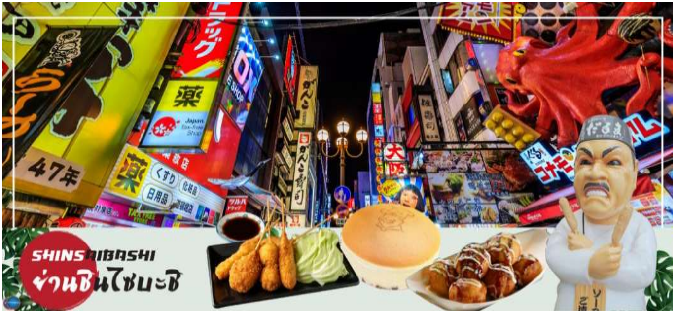
เย็น รับประทานอาหารเย็นอิสระตามอัธยาศัย

อิสระช้อปปิ้ง ย่านชินไซบาชิ (Shinsaibashi) บริเวณแหล่งช้อปปิ้งแห่งนี้มีความยาวประมาณ 600 เมตร เต็มไปด้วยร้านค้าปลีก ร้านแฟชั่นร้านเครื่องสำอางค์ ร้านรองเท้า กระเป๋า นาฬิกา ร้านกาแฟ ร้านอาหาร ร้านขนม ร้านเสื้อผ้าสตรีทแบรนด์ทั้งญี่ปุ่นและต่างประเทศ เช่น Zara H&M Beans ABC Mart เป็นต้น เรียกว่ามีทุกอย่างที่ต้องการรวมกันอยู่บริเวณนี้ ใกล้กันท่านสามารถเดินไปยัง ย่านโดทงโบริ (Dotonbori) ย่านบันเทิงยามค่ำคินดอลอดแนวถนนเลียบบคลองโดทงโบริ จากสะพานโดทงโบริบาชิไปจนถึงสะพานนิปปอนบาชิ ไฮไลท์!!! ใครๆ ก็เชคอิน ถ่ายภาพคู่ ป้ายกูลิโกะแมน หรือ ป้ายโดทงโบริกูลิโกะ (Dotonbori Glico Sign) เป็นป้ายไฟนีออนรูปนักกรีฑากำลังวิ่งอยู่บนลู่วิ่ง ซึ่งถูกติดตั้งมาตั้งแต่ ปี ค.ศ.1935 นอกจากนี้ยังมีอีกหนึ่งสัญลักษณ์สถานที่นัดพบกันหลง นั่นก็คือ ร้านคานิดอรากุ (Kani Doraku) ซึ่งมีปูยักษ์ขยับแขนและลูกตาได้อีกด้วย และห้ามพลาดสำหรับทาโกะยากิ อาหารท้องถิ่นของชาวโอซาก้า ที่มาถึงถิ่นแล้วต้องลอง Original Taste รับรองไม่ผิดหวังแน่นอน