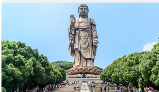
พระใหญ่หลิงซานต้าฝอ