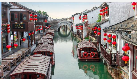
ถนนโบราณซานตางเจีย