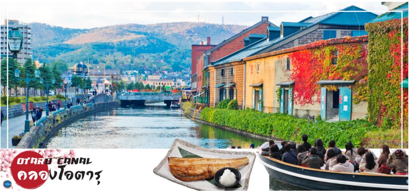
OTARU CANAL คลองโอตารุ

เมืองซัปโปโร – ดิวตี้ฟรี – เมืองโอตารุ – คลองโอตารุ – พิพิธภัณฑ์กล่องดนตรี – เมืองซัปโปโร – ศาลาว่าการเมืองซอกไกโดหลังเก่า (ด้านนอก) – ผ่านชม หอนาฬิกาเมือง – ซ้อปปิ้งทานุกิโคจิ