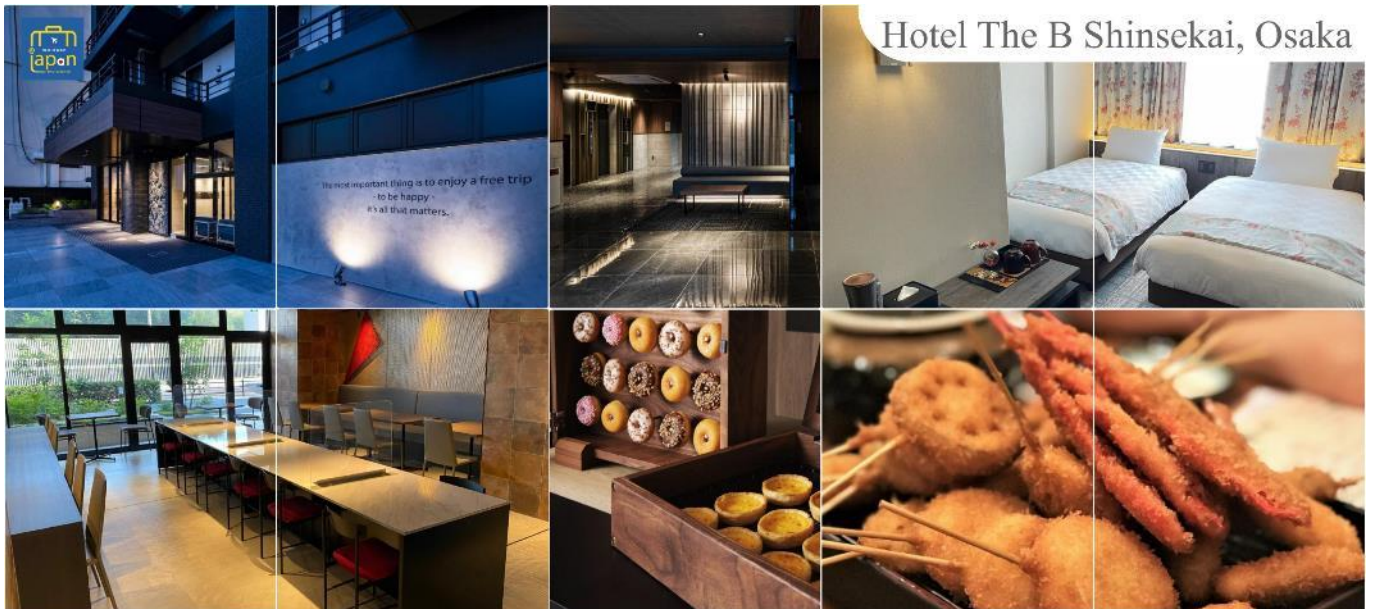
Hotel The B Shinsekai, Osaka

พักที่ HOTEL THE B SHINSEKAI, OSAKA หรือเทียบเท่าระดับเดียวกัน