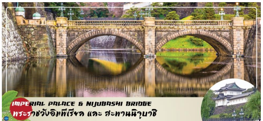
IMPERIAL PALACE & NIJUBASHI BRIDGE พระราชวังอิมพีเรียล และ สะพานนิจูบashi

เสน่ห์ของสะพานข้ามคูน้ำ สู่ พระ รา ช วั ง แห่ง กรุงโตเกียว ที่มีชื่อเรียกว่า แว่นดาก็เพราะส่วนโค้งที่อยู่ติดกันด้านล่างสะพาน นั้นมีรูปร่างเหมือนแว่นดา เมื่อสะท้อนกับผิวน้ำ ส่วน ทางด้านหน้าพระราชวัง เป็นอุทยานแห่งชาติโคเคียวไกเอ็น (Kokyo Gaien National Garden) เป็นสวนสาธารณะขนาดใหญ่