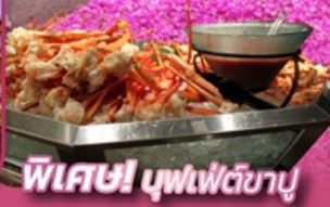
พิเศษ! บุฟเฟ่ต์ชาบู