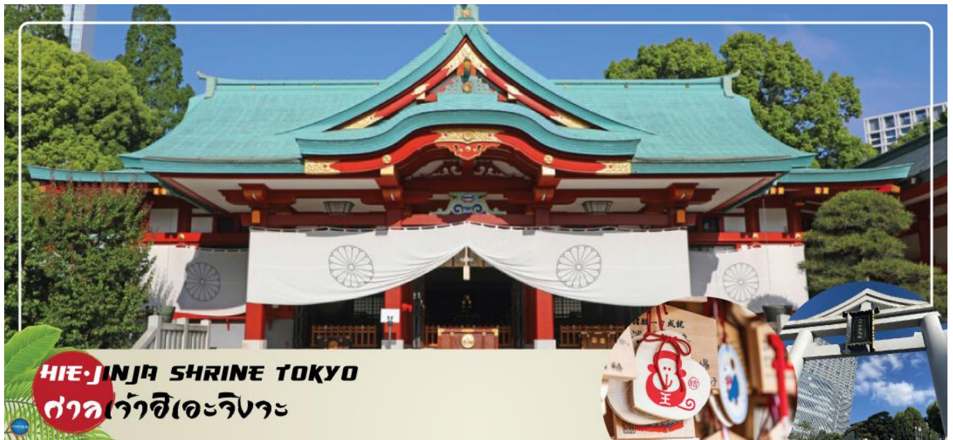
HIE-JINJA SHRINE TOKYO ศาลเจ้าฮิเอะจิงจะ

วันที่สี่ เมืองนาริตะ – กรุงโตเกียว – ศาลเจ้าฮิเอะจิงจะ – พระราชวังอิมพีเรียล (ด้านนอก) – สะพานแว่นดา – ตลาดปลาซึกิจิ – ย่านโอไดบะ – ห้างไดเวอร์ซิตี – เมืองนาริตะ – อีออนมอลล์ ภาครัฐ