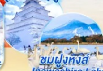
ชมฝูงหงส์ Inawashiro Lake