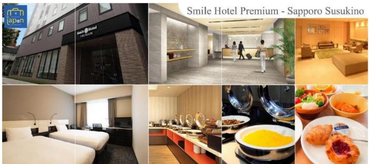
Smile Hotel Premium - Sapporo Susukino

SMILE HOTEL PREMIUM - SAPPORO SUSUKINO หรือเทียบเท่าระดับเดียวกัน