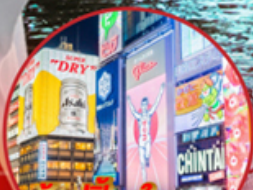
ช้อปปิ้งจุใจ..... Shinsaibashi

โอโห้!! ชมใบไม้เปลี่ยนสีที่สวยงามที่สุดในภูมิภาค ณ หมู่เขาโคริงเค อลังการไฟลันดวง ณ หมู่บ้านนาบะ โนะ ซาโตะ ชม หมู่บ้านมรดกโลกการ์นิโตโดย UNESCO ณ หมู่บ้านชิราคาวาโตะ ปราสาทมัตสึโมโตะ เป็น 1 ใน 12 ปราสาทดั้งเดิมที่ยังคงสมบูรณ์และสวยงาม ชมสวนสโตนี่ญี่ปุ่น และเยือน วัดกินคะคุจิ หรือ วัดเงิน แห่งเมืองเกียวโต