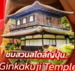
ชมสวนสโตนี่ญี่ปุ่น.. Ginkakuji Temple