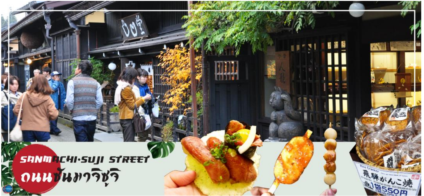
SANMACHI-SUJI STREET ถนนซันมาจิซุจิ