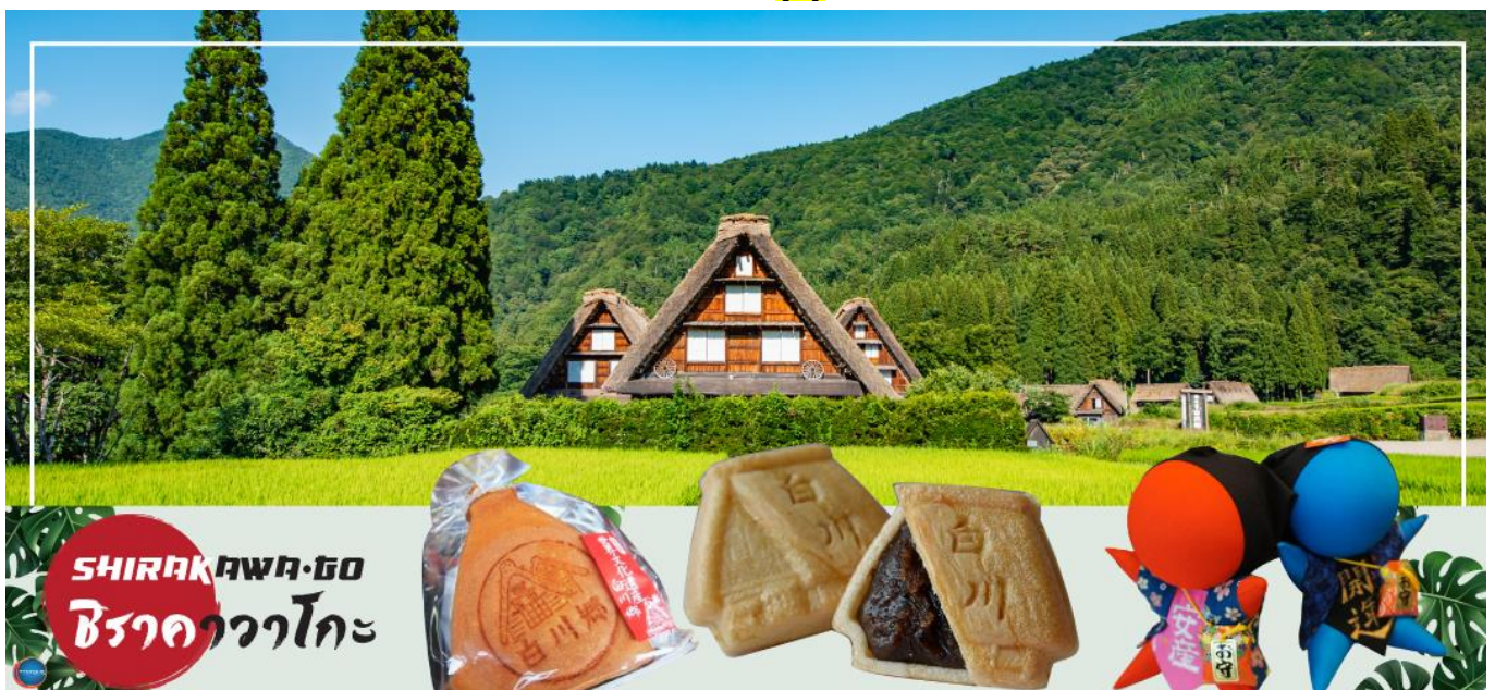
SHIRAKAWA-GO ชิราคาวาโกะ

จากนั้นนำท่านสู่ หมู่บ้านมรดกโลก ชิราคาวาโกะ (Shirakawa-go) (ใช้เวลาเดินทางประมาณ 30 นาที) เมืองที่เป็นมรดกโลกทางวัฒนธรรมของประเทศญี่ปุ่น เป็นหมู่บ้านชาวนาที่มีรูปร่างแปลกตาติดอันดับ The most beautiful village in Japan และเป็นเมืองมรดกโลกที่มีชื่อเสียงแห่งหนึ่ง ไฮไลท์!! หมู่บ้านแบบกัชโชสึคิри เป็นบ้านชาวนาโบราณที่มีอายุมากกว่า 250 ปี คำว่า กัชโช มีความหมายว่า พนมมือ ซึ่งเป็นการบ่งบอกถึงลักษณะ รูปแบบของบ้านที่มีหลังคามุงด้วยฟางข้าวที่