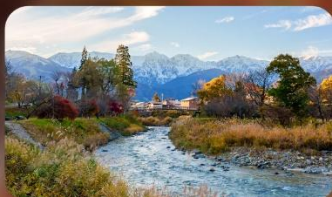
โออิเดะปาร์ค