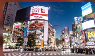
ซ้อปปิ้งชินจูกุ