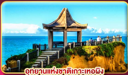
อุทยานแห่งชาติเกาะเหอผิง