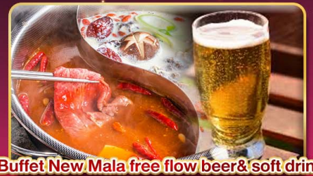
*Buffet New Mala free flow beer & soft drink