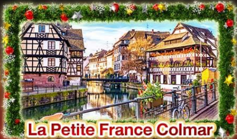
La Petite France Colmar