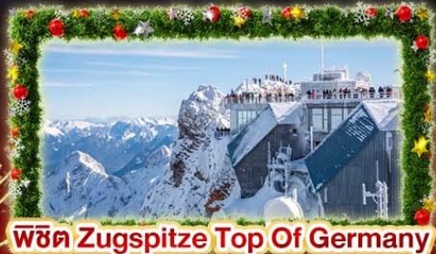
พีชิต Zugspitze Top Of Germany