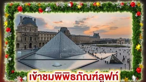
เจ้าชมพิพิธภัณฑ์ลูฟร์