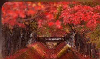
อุโมงค์เมเปิ้ลโมมิจิโคโร