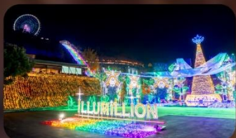
งานประดับไฟ Sagamiko Illumination