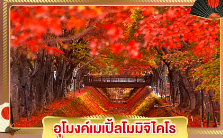
อุโมงค์เมเปิ้ลโมมิจิโคโร