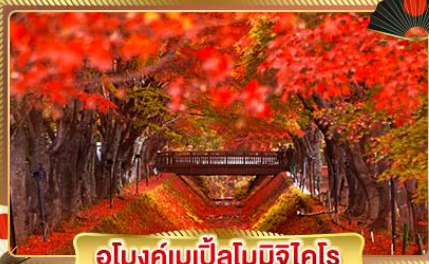
อุโมงค์เมเปิ้ลโมมิจิโคโร