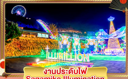
งานประดับไฟ Sagamiko Illumination