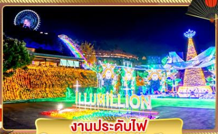
งานประดับไฟ Sagamiko Illumination