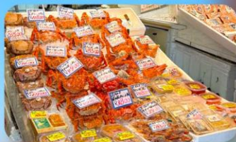
ตลาดปลาโจโก