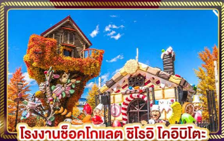
โรงงานช็อคโกแลต ชิโรอิ โคอิโตะ