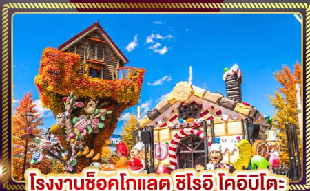
โรงงานช็อคโกแลต ชิโร โคอิจิโตะ