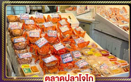
ตลาดปลาโจโก