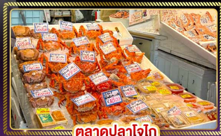
ตลาดปลาโจโก