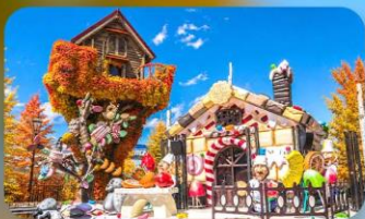
โรงงานช็อกโกแลต ชิโรอิ โคอิบิโตะ