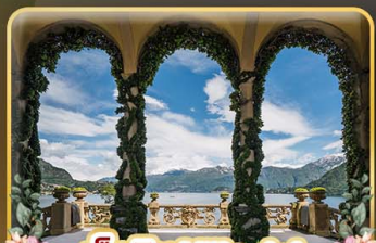
เชิควิน Villa del Balbianello

ที่สุดของธรรมชาติแห่งอิตาลี ทิวเขา ทะเลสาบ ความงามแห่งโดโลไมท์