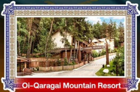
Oi-Qaragai Mountain Resort