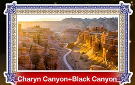
Charyn Canyon+Black Canyon