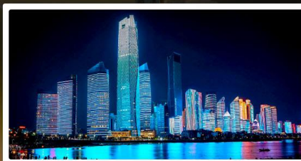
หาดไซเบอร์ฟิงก์