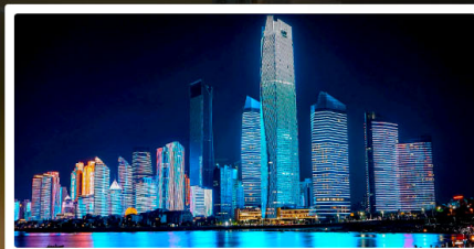
หาดไซเบอร์พิงก์